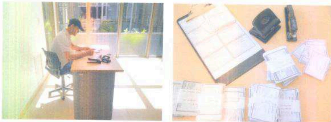
Foto 6 y 7. Conteo de boletas para entregar a la unidad de vigilancia, mes de noviembre.