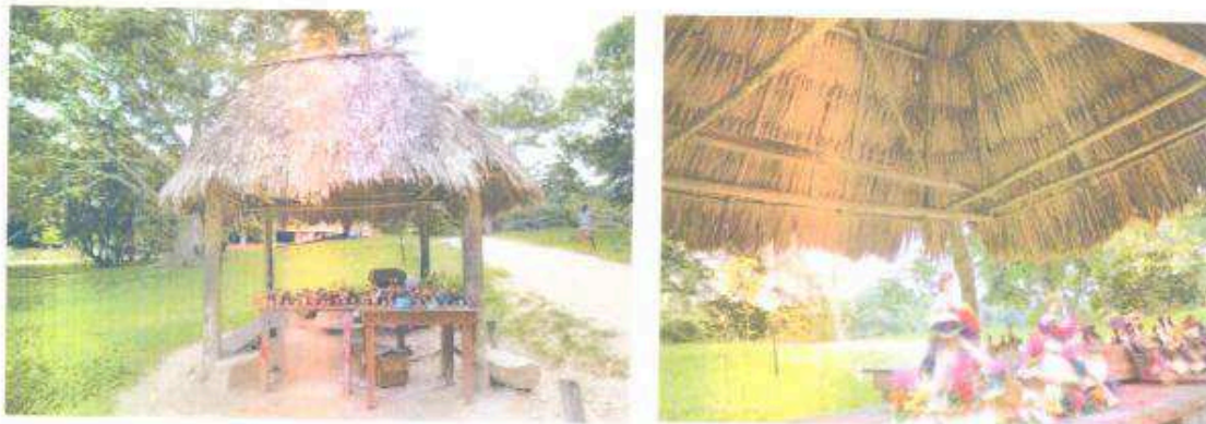
Foto 1 y 2. Estado actual de la cubierta, venta de artesanías de Uaxactún.